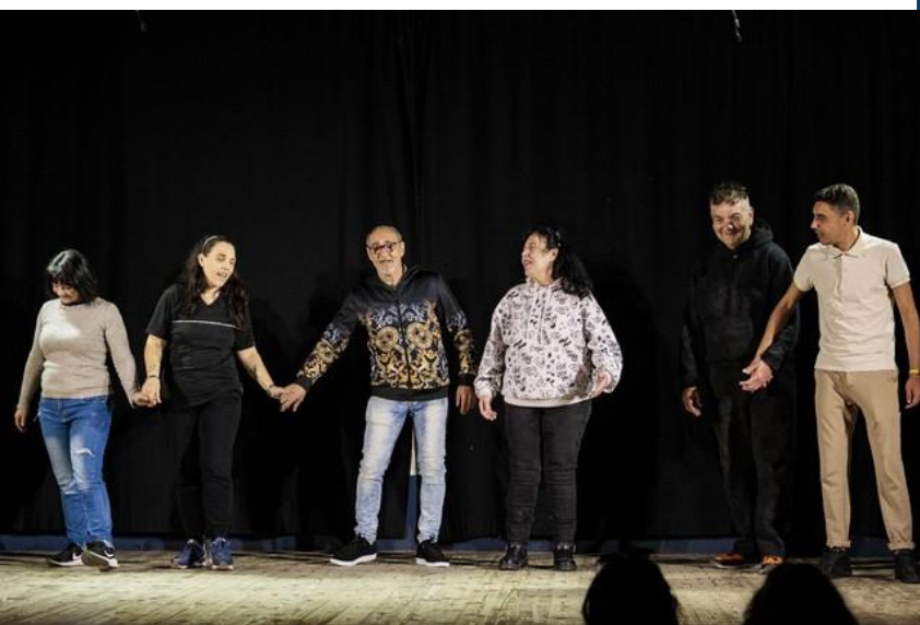
Un momento dello spettacolo