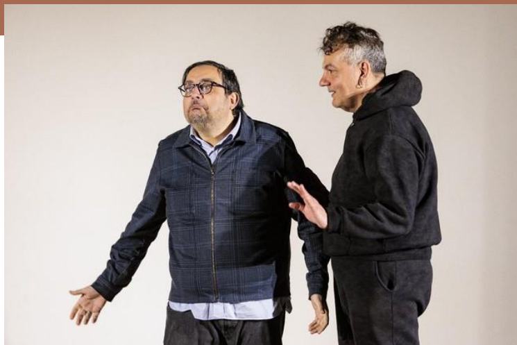
un momento dello spettacolo

“Mai capitato al mondo” non è solo uno spettacolo teatrale: è il risultato di un percorso umano e artistico iniziato nell’ottobre 2024, che ha coinvolto nove persone SENZA DIMORA in un laboratorio di espressione teatrale, narrazione autobiografica e costruzione di relazioni significative. Sotto la guida del regista Orazio Bottiglieri, il gruppo ha trasformato dolore, solitudine ed emarginazione in racconto, ironia e presenza scenica, dimostrando come l’arte possa diventare uno strumento di dignità, cura e riscatto.